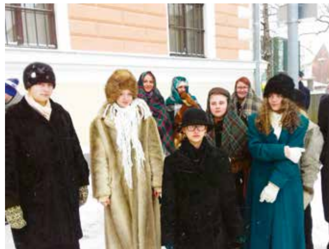
Ajarännakuks valmistumisel tuli õpilastel leida sobivad, ajastutruud riided ning mõelda endale roll, keda ajarännakul kehastada.

ANU LAARMANN Mõisaküla muuseumi juhataja