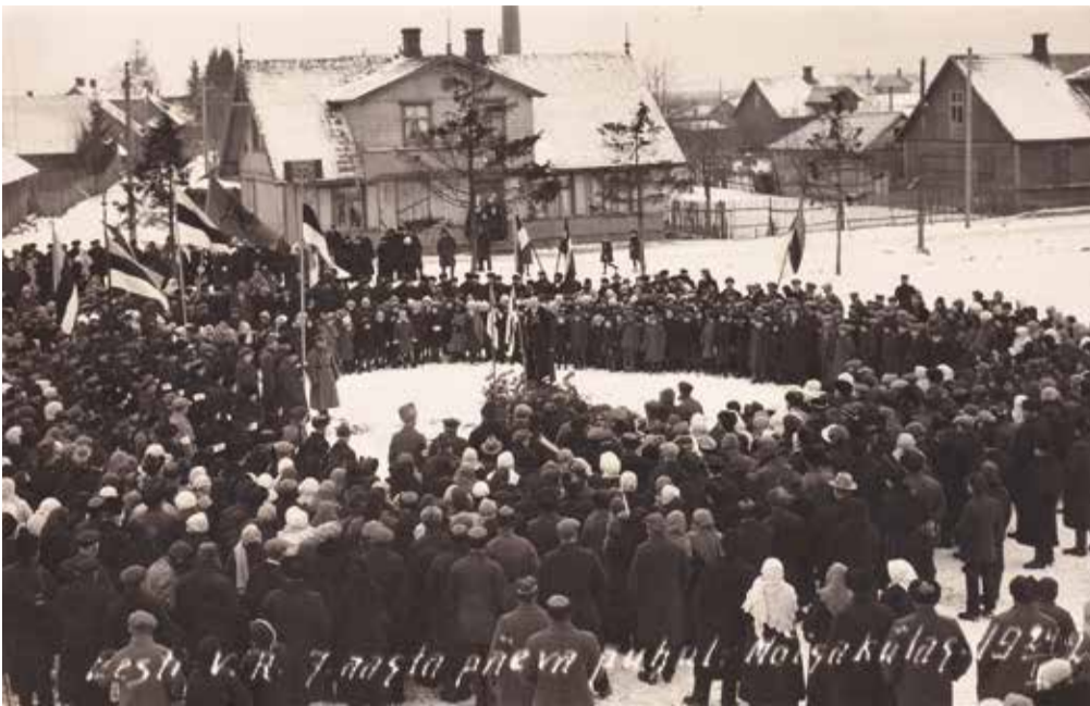
Eesti Vabariigi 7. a.p. tähistamine Mõisakülas 24.02.1925. a. Pildil oleva maja kohal asub praegu koolimaja.

Ajarännakuks valmistumisel tuli õpilastel leida sobivad, ajastutruud riided, õppida selgeks laulud ning mõelda