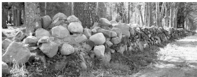
Pärandipaikade hulka, mis ootavad korrastamist, kuuluvad ka kalmistud. Pildil Halliste kalmistu iidne müür.

MTÜ Estlander kutsub kooliõpilasi laste- ja noortekultuuri teema-aasta ja ka aprillist algava Eesti Vabariigi 100. sünnipäeva tähistamise raames tegema isamaale väärrika kingituse, korrastades kodukohas hooletusse jäänud pärandipaiku.