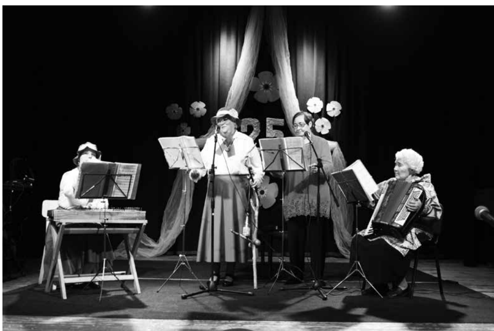
Kapell De La Roza.

hedalt ja kaugelt, esinetud on paljudes kohtades üle Eestimaa ning samuti Lätis ja Soomes.