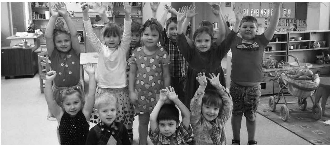
Sõbrapäeval, nagu traditsiooniks on saanud, kandsime punast värvi riideeset.