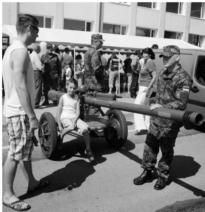
Huviga uudistas rahvas maakaitsepäeval Mõisakülas keskvaljakule vaatamiseks seatud Kaitseliidu Sakala maleva relvastust.

Viljandist saabus Mõisaküla keskvaljakule autokolonn kaitseleitlaste ja eritehnikaga. Püstitati telgid ja seati üles relvanäitus ning väliköök. End tutvustasid Naiskodukaitse ja Kaitseliidu noorteorganisatsioonid, jagades õhupalle, lipukeid ja flaiereid. Tehnikanäituse olid üles pannud lisaks Kaitseleitlasele ka politsei- ja piirivalveamet, päästeamet ning Punane Rist. Linnavalitsuse esisel ja selle ümbruses kihas jaanilaat. Keskvaljakul uudistas hulk rahvast tehnikat ja relvastust