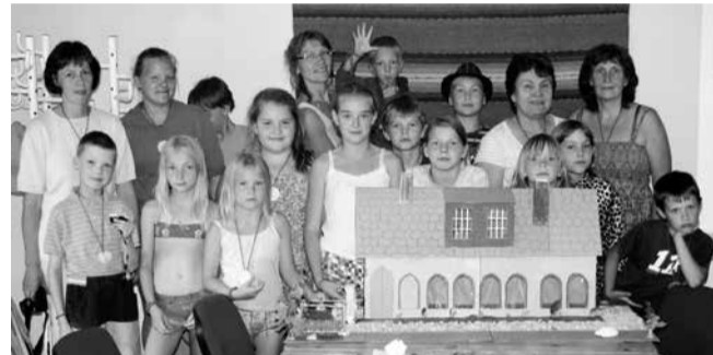
Laagri lõpupilt Uue-Kariste rahvamajas tehti laste meisterdatud uhke majamaketi taustal.