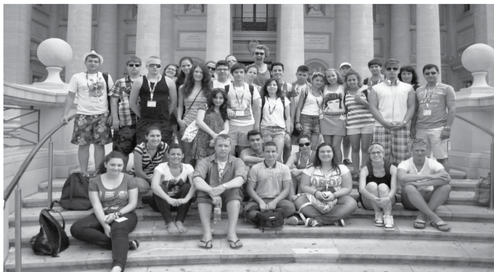
Suur grupp kirikutrepil Mosta linnas.

Kui 2012. aastal oli võõrustajariigiks Türgi, siis 2013. suvel võttis meid vastu Vahemere keskel asuv Malta Vabariik, projekti „We are the World“ tegevuskava koostasid noored, keda koondab Mosta linna noortekeskus. Kui Türgis käisime 6-liikmelise grupiga ja meid majutati kodudes (mis olid ääretult külalishked), siis Maltale oli kutsutud 12 noort + 2 juhendajat. Majutus- ja seminariruumid olid Rabati linnas Al Virtu vaimuliku seminari kaasaegselt renoveeritud hoones. Meil õnnestus käia ka Mosta, Valletta ja Sliema linnades ja tutvuda Malta keele ja kultuuri ning vaatamisväärsustega. Malta noored ja nende juhendajad on sama rõõmsad ja säravad nagu Malta päikesepaisteline taevas ja selge sinine meri. Noortevahetused on mitteformaalne õpe, mis õpetab noortele erinevate kultuuride mõistmist, Euroopa kodanikuks olemist ja poliitilise kultuuri mõisteid nagu sallivus ja usaldus noortepärase tegevuste ja ettevõtmiste kaudu. Nii olid meil Malta, Türgi ja Eesti õhtud ja õpitoad, noorte endi korraldatud orienteeru-