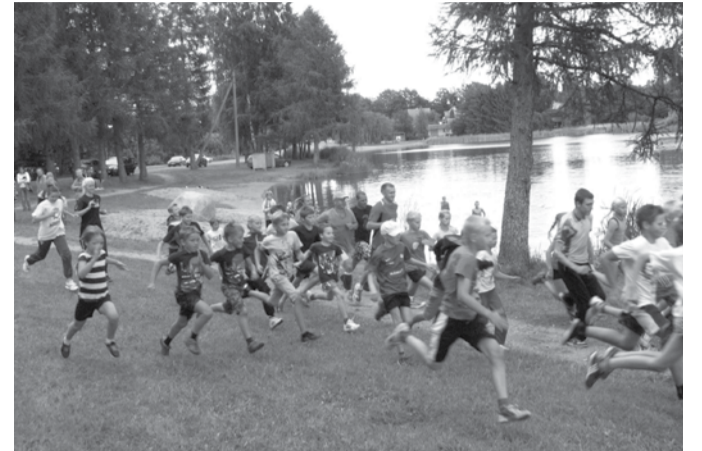
Traditsioonilise ümber järve jooksu start.

Traditsiooniliselt oli suvepäevade raames kavas järvejooks, rammumehe valimine ja rannavõrkpalli turniir.