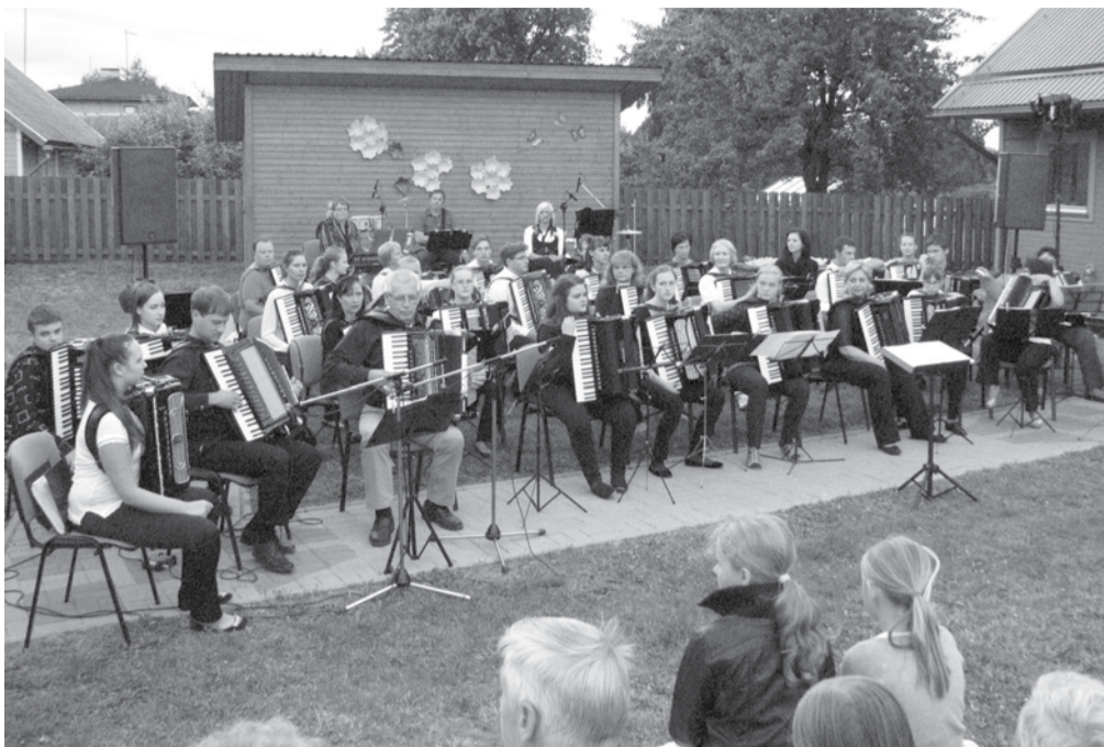
Abja suvepäevade avakontserdil võis näha suurt hulka akordioneid.